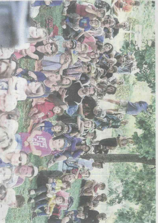
Sous les arbres, le public peut assister au spectacle à l'abri des rayons du soleil.

Retrouvez + de photos sur vosgesmatin.fr et sur notre appli mobile