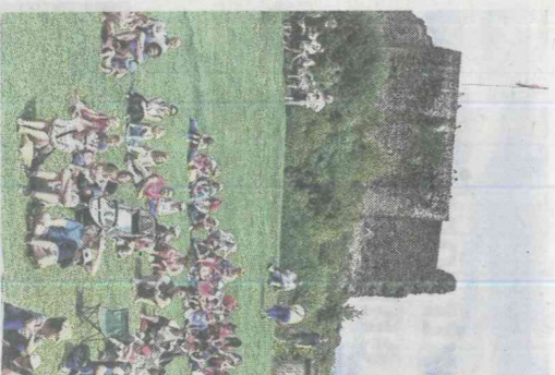
Le talus devant le château sert de tribune naturelle.